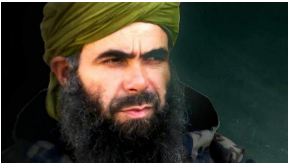
Figura 1. Abdelmalek Droukdel , también conocido como Abu Musab Abdel Wadoud.

El pasado 5 de junio, la ministra de defensa francesa, Florence Parly, anunciaba a través de redes sociales la eliminación de un peso pesado en la escena yihadista internacional. El emir de al-Qaeda en el Magreb Islamico (AQMI), Abdelmalek Droukdel , también conocido por su kunya 1 Abu Musab Abdel Wadoud , había sido neutralizado junto a varios de sus colaboradores el 3 de junio en una operación conjunta de las fuerzas armadas francesas, y sus socios, que se desarrolló en el norte de Malí.