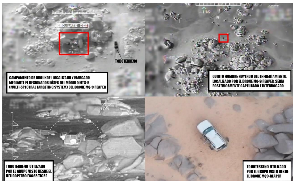
Figura 2. Explicación de algunas de las imágenes de la operación liberadas por el EMAD francés.

No se ha facilitado ninguna imagen del cadáver de Droukdel por parte de Francia, ya que, en palabras del EMAD francés, “ no es necesario aportar eso para saber que está muerto ”. Los eliminados fueron enterrados en el lugar de la operación militar por las fuerzas francesas.