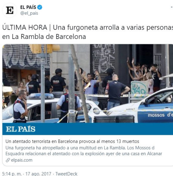
Figura 19. El primer tuit de El País describió lo sucedido. La calificación en el titular de la noticia con la que enlaza corresponde a una edición posterior

En un primer vistazo salta a la vista que la naturaleza informativa del actor en cuestión le hace publicar mucho más que las fuentes oficiales. Se trata de un dato esperable y que se cumplirá con el resto de medios de comunicación. El primer tuit publicado por El País sobre el atentado está datado a las 17:14hrs. (fig. 19). A pesar de que la vista previa del artículo al que enlaza contiene como titular “Un ‘atentado terrorista’ en Barcelona provoca al menos 13 muertos”, debe tenerse en cuenta que la página web fue actualizada y que no era ese el contenido que mostraba en el momento de publicación del tuit (la información de la web reza “El Estado Islámico (...) golpeó ‘ayer’ el corazón de Barcelona”). El texto del tuit, que Twitter no permite cambiar a sus usuarios, al contrario que otras redes sociales, informa de modo genérico de que “una furgoneta arrolla a varias personas en La Rambla de Barcelona”.