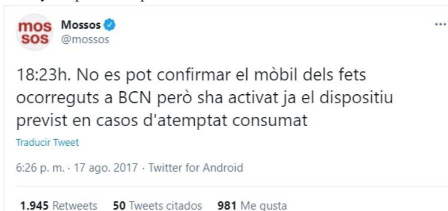
Figura 13. Los Mossos informan en catalán de que, aunque no se conoce el móvil de los hechos, se ha activado el dispositivo para casos de atentados consumados.

Se da la circunstancia de que, uno de los primeros tuits sobre el hecho, en inglés, a las 17:19hrs, lo califica de “ trampling ” (‘estampida’, ‘avalancha humana’), lo que puede corresponder a una mala traducción o al primer mensaje equívoco oficial. A partir de las 18:23, tres tuits se refieren, en catalán (“ atentat consumat ”), inglés (“ consummate attack ”) y español (“atentado consumado”), directamente al problema de la calificación de los hechos en relación con el tratamiento policial (fig.13). Advierte de que, aunque no se conoce la motivación del atropello, se ha activado ya el protocolo por atentado.