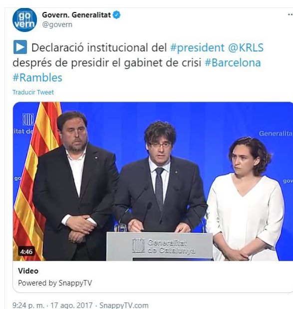
Figura 9. Declaración institucional del Presidente

Los mensajes en Twitter del Gobierno autonómico catalán dirigieron en varias ocasiones a sus perfiles de emergencias y policiales para más obtener información oficial sobre los hechos. Convierte #atropellament en hashtag. Al igual que la Policía Nacional, habla primero de ‘ataque’/‘atentado’ en idioma extranjero ( attack , 18:06) cuando antes y después emplea en catalán ‘atropellament’ . A las 21:24 cuelga un vídeo de la declaración oficial del presidente Carles Puigdemont (fig. 9) y a las 22:06 una imagen con el texto de la misma. En ambas, en las que hay directas referencias a la confrontación con el terrorismo, las expresiones usadas son ‘acte violent’ y ‘acte’ . En los últimos tuits sobre el hecho del día, la Generalitat emplea la expresión ‘atemptat terrorista’ .