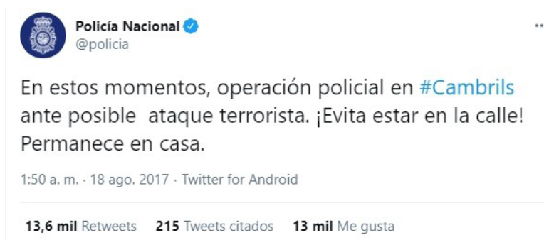
Figura 6. Se trata de la primera ocasión en la que la Policía califica los hechos de esas horas con la expresión ‘atentado’/‘ataque’ en castellano, aunque se refiere a Cambrils y la calificación parte de los Mossos.

Se da la circunstancia de que la primera vez que lo denomina ‘atentado’/‘ataque’, lo que implica una intención delictiva, lo hace en inglés (19:43) y francés (20:02). Hasta entonces había empleado la palabra castellana ‘atropello’, más conservadora y menos comprometida y que, en rigor lingüístico, aún dejaba abierta la posibilidad de que fuese un accidente, si bien a esas alturas era ya de general conocimiento la naturaleza del hecho. Al final del día, publicó mensajes más emotivos sobre la unión de la sociedad y el pésame a los familiares de las víctimas. A la 01:50 horas del día 18, alerta a los usuarios de lo que ya estaba sucediendo en Cambrils con la expresión “posible ataque terrorista” (fig. 6), que partía de los Mossos (fig. 12).