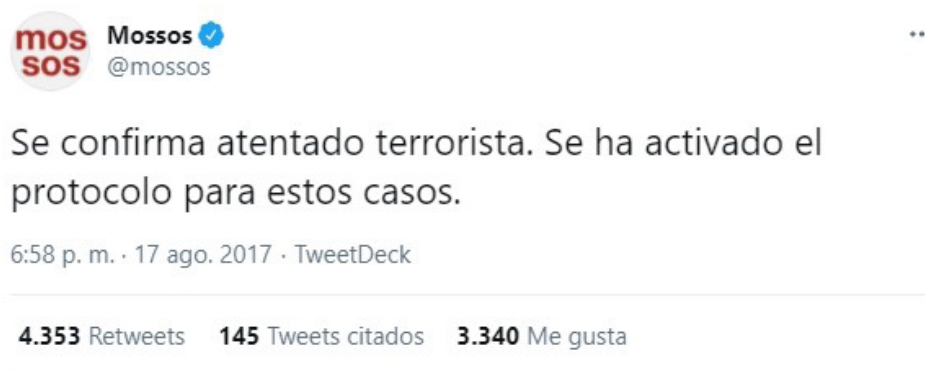
Figura 14. Información de los Mossos

Media hora más tarde, tres nuevos tuits en los mismos idiomas confirman la calificación: “atentado terrorista” (fig.14).