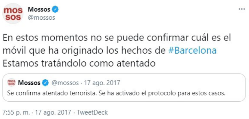
Figura 15. Los Mossos vuelven a establecer una cautela sobre la naturaleza de los hechos.

De manera confusa y puede que errática, la propia cuenta matizará de nuevo que no se conoce el móvil, rectificando su propia publicación anterior. Se informa de que, sin saber si es un atentado aún, los Mossos lo están tratando como tal (fig.15).